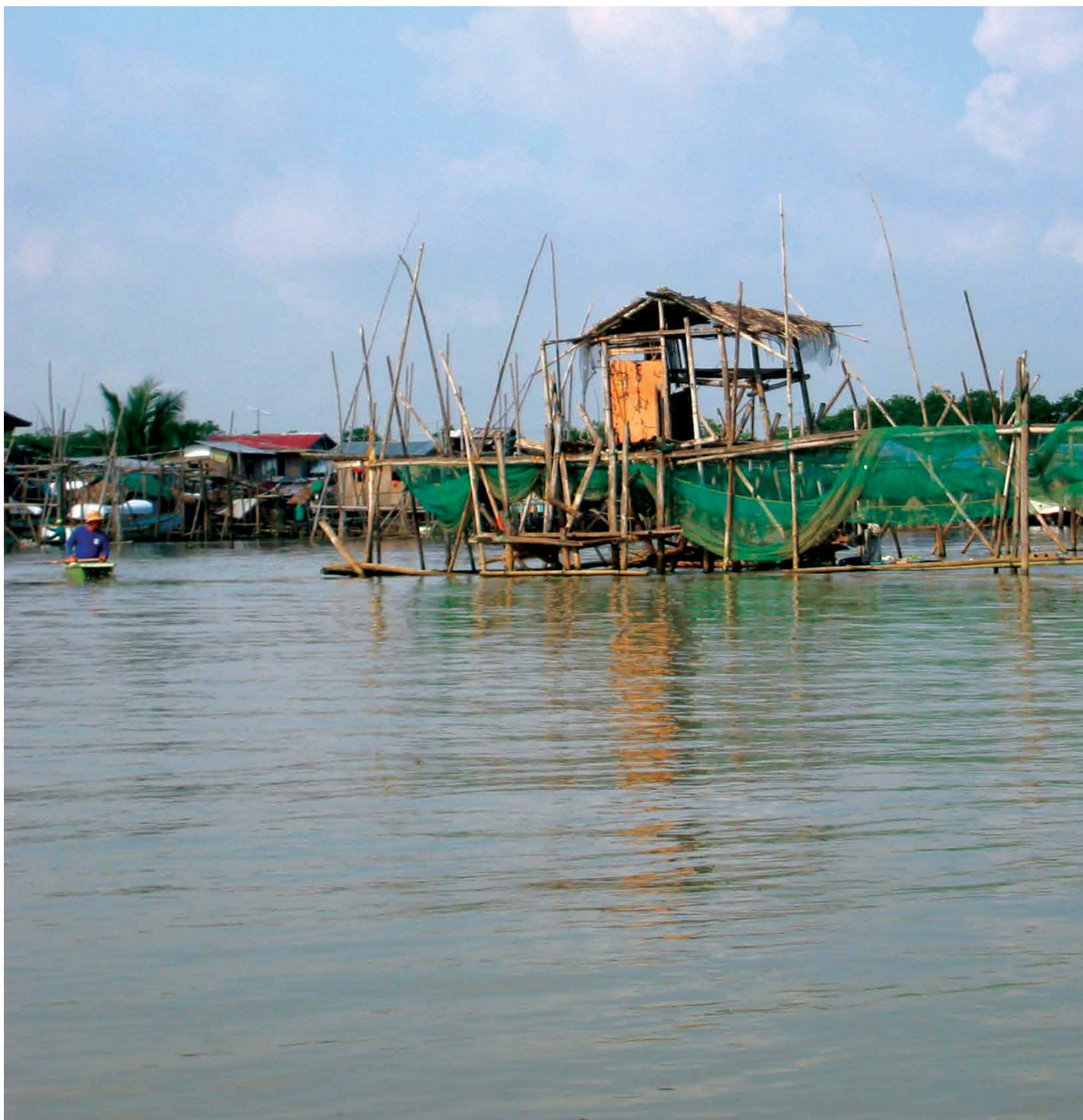
Baño en el agua en Filipinas

Mientras el PCM de OMS/UNICEF está facilitando el proceso técnico, ha comenzado un proceso político paralelo, en el que muchos grupos se acercan a los estados miembros de las Naciones Unidas para abogar por la iniciativa WASH con miras a los debates más amplios sobre la agenda para después de 2015. Independientemente de cuál sea el marco que se adopte para la agenda para el desarrollo después de 2015, estas metas ambiciosas pero realistas tienen la capacidad de orientar hacia la consecución de mejores servicios de agua, saneamiento e higiene para todos, y de esa manera ayudar a reducir la pobreza y lograr un desarrollo sostenible.