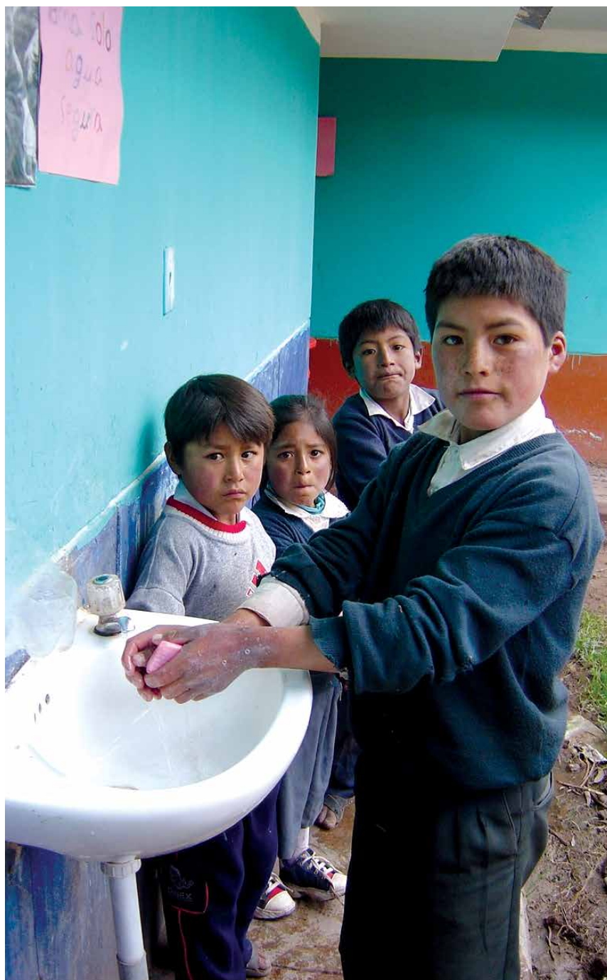
Niños lavándose las manos en Perú.

Hay entre una y tres metas por subsector, y cada una de ellas tiene un conjunto de indicadores adjuntos que son inequívocos, se expresan con un lenguaje sencillo para que comunicarlos sea lo más fácil posible, y se evita la jerga profesional y el exceso de adjetivos. Las metas son cohesivas y cada una de ellas comprende definiciones claras y completas, expresadas en términos de un conjunto de fechas en las que los diferentes niveles de reducción de la desigualdad y las mejoras en los niveles de servicio y en las prácticas habrán ocurrido; al mismo tiempo respetan cada subsector por igual (sin permitir que uno de ellos subsuma a otro). Todavía no se ha fijado el año meta para el futuro marco global para el desarrollo, por lo que se toma un período de 25 años, entre 2015 y 2040.