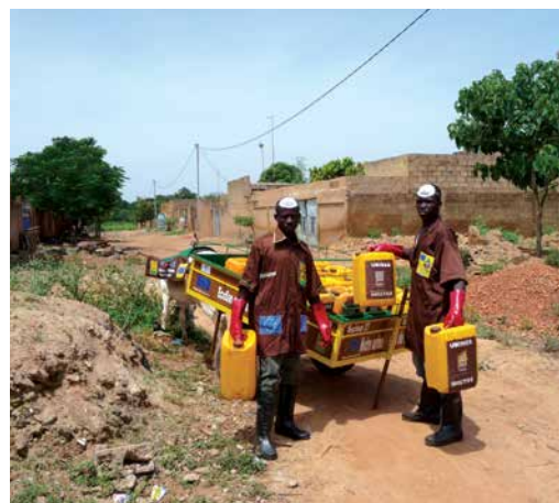
trabajadores de saneamiento en Burkina Faso.

partes de de estas personas viven en zonas rurales. Cerca de mil millones de personas todavía practican la defecación al aire libre (el 15 por ciento de la población mundial). No se logrará cumplir el ODM en materia de saneamiento y dos mil quinientos millones de personas siguen sin tener acceso a instalaciones de saneamiento básicas. En las zonas rurales y urbanas hay desigualdades: las zonas rurales tienen la cobertura más baja y son las más pobres, mientras que los altos niveles de urbanización y la degradación ambiental indican que los desafíos del futuro serán urbanos, en particular en los asentamientos marginales. Sin embargo, las desigualdades se extienden más allá de la riqueza y la geografía: es más probable que la carga de la recogida de agua recaiga sobre las mujeres; aquellas que no tienen acceso a instalaciones de saneamiento sufren la indignidad de tener que defecar al aire libre y corren el riesgo de ser violadas y atacadas; y la falta generalizada de instalaciones para la gestión de la higiene menstrual limita la participación de mujeres y niñas en la educación y los lugares de trabajo. Más aún, muchos grupos que sufren exclusión por razones étnicas o por su casta se encuentran también en desventaja con respecto al acceso al agua, saneamiento e higiene.