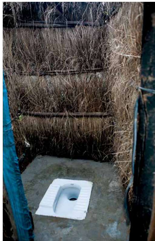
Pueblo Khemji, Warore Block, Dist. Chandrapur. Un baño construido manualmente cuyos muros estan hechos de pilas de hierba.